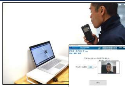
アルコールチェック