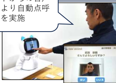
顔認証による運転者の本人確認