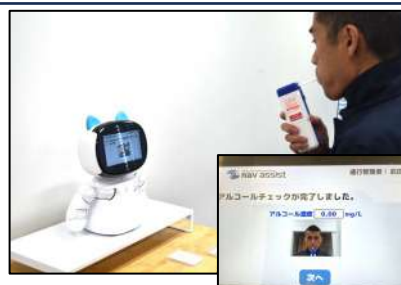
アルコールチェック