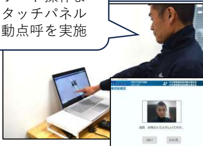
顔認証による運転者の本人確認