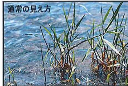
水面に太陽光が反射して水底が見えない。