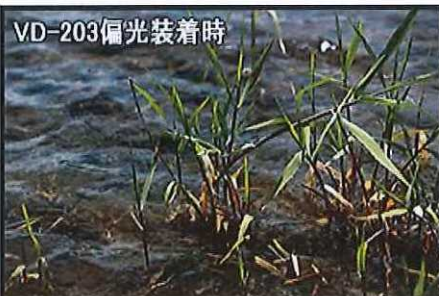
反射光がカットされて水底までよく見える。